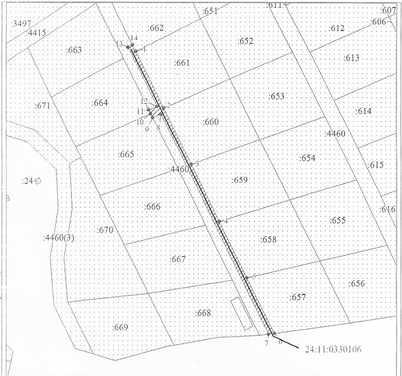
Схема расположения местоположения границ публичного сервитута