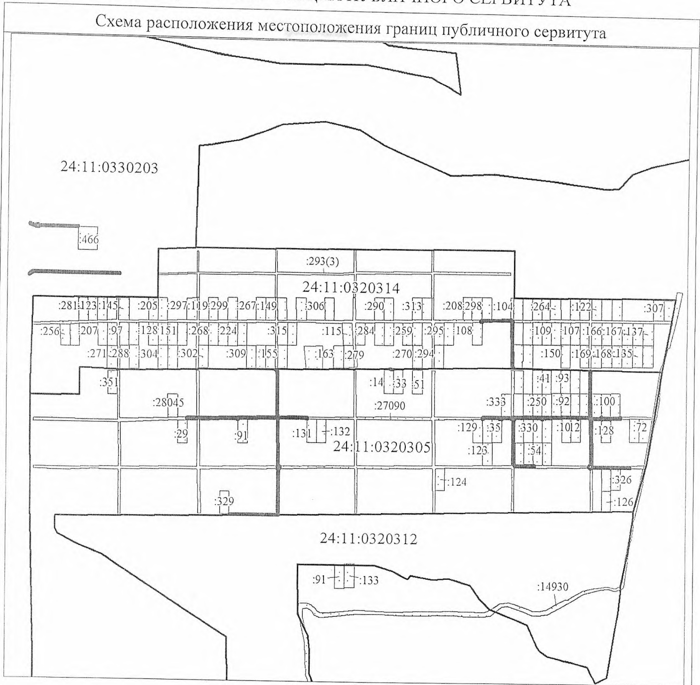
Схема расположения местоположения границ публичного сервитута