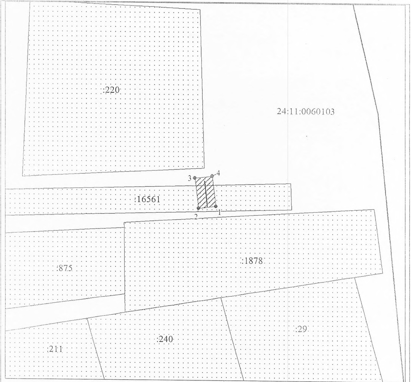
Схема расположения местоположения границ публичного сервитута